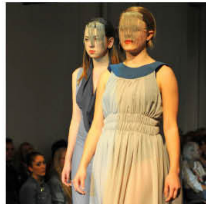
Modenschauen sind die Highlights des Schuljahres.

• Ein Special gibt's für das Abendkolleg Schmuck mit Führungen durch die Werkstätten. Diese finden am Freitag, 24. November, von 16.30 bis 20 Uhr statt. Treffpunkt: Aula.